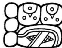
OX la-ta 3 días