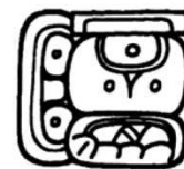
u JO la-ta 5 días