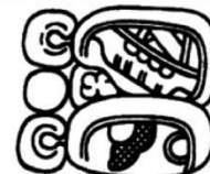
JUN PAS 1 día