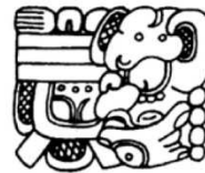
TAN LAM-mi K'ATUN